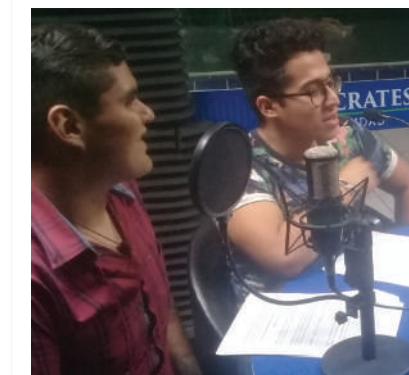
Pág. 24. La continuidad de los programas de radio de difusión cultural en la Universidad Hipócrates