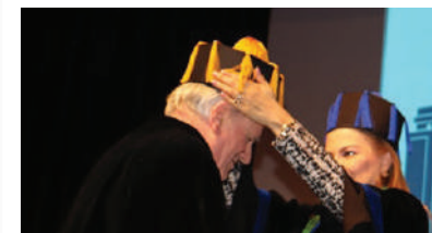
Pág. 5. La Universidad Hipócrates entregó el Doctorado Honoris Causa al destacado Dr. Valentín Fuster