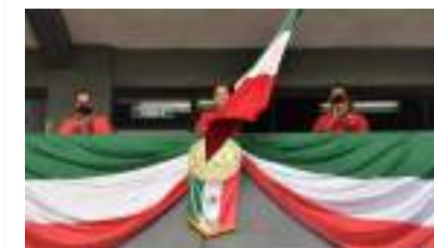
Pág. 8. La Universidad Hipócrates celebra el 212 aniversario del inicio de la independencia de México