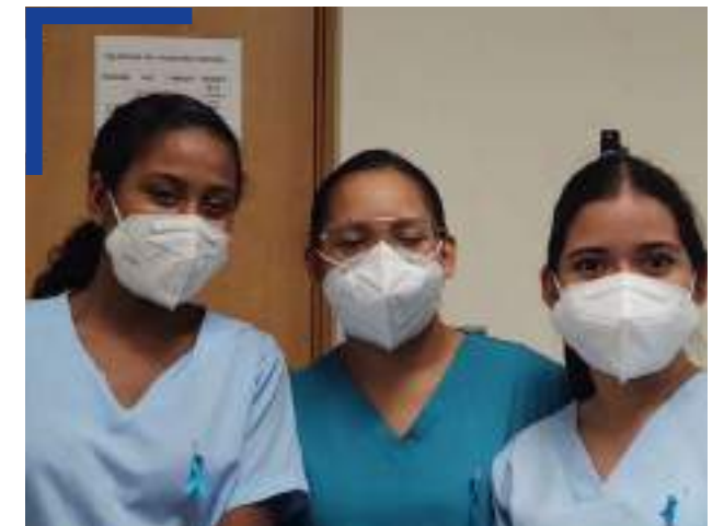
Hospital General Acapulco

Luego de 1 año de actividades en diversas instituciones de salud como: Hospital General de Acapulco, Hospital General "Dr. Donato G. Alarcón", Instituto Estatal de Cancerología, Unidad de Medicina Familiar ISSSTE Acapulco, Unidades de Medicina Familiar y Hospitales del Instituto Mexicano del Seguro Social y Hospital Naval de Acapulco, los egresados de la Licenciatura de Nutrición de la Universidad Hipócrates tuvieron la oportunidad de poner en práctica y al servicio de la comunidad todos los conocimientos, habilidades y destrezas adquiridas durante su formación académica, participando en diversas actividades, como capacitaciones, orientaciones nutricionales a la población en general y a pacientes con padecimientos específicos, y colaborando en eventos y jornadas de promoción a la salud.