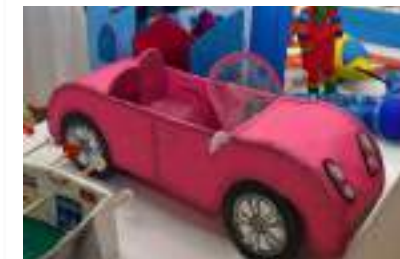
Pág. 4. Haz eco