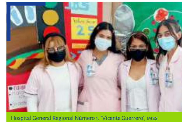
Hospital General Regional Número 1. "Vicente Guerrero", IMSS

Es importante destacar que durante dicho periodo de pasantía, los egresados se encontraron bajo la asesoría de profesionistas y jefes de servicio altamente capacitados en campo de la nutrición humana, orientando las actividades desarrolladas por nuestros pasantes y favoreciendo la consolidación de su formación académica.