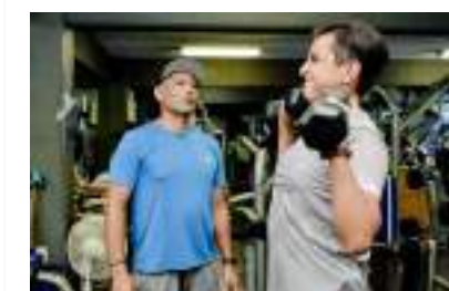
Pág. 22. La Universidad Hipócrates cuenta con un gimnasio equipado