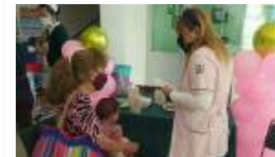
Pág. 5. Pasantes de la licenciatura en nutrición culminan exitosamente...